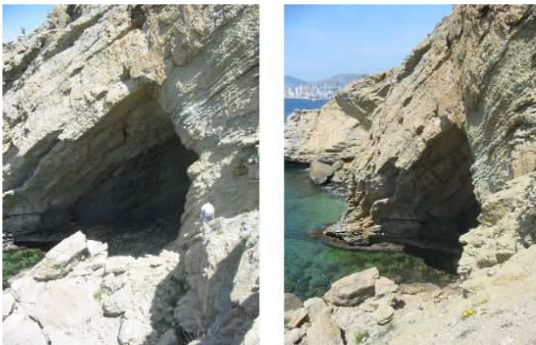
Cueva que se encuentra debajo de la Punta de la Aladraba.