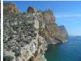
La cova de bou.

En las cercanías de la Cala del Ti Ximo tenemos también restos de un asentamiento Ibero-Romano, sin duda relacionado con las cercanas minas de ocre que allí se encuentran. Se localizan también restos romanos en la denominada Cueva del Infierno, situada en la antigua cantera.