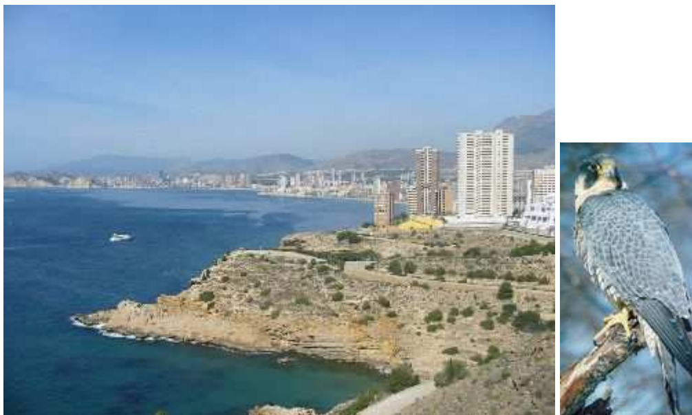
Punta de la Aladraba con Benidorm al fondo.

Sierra Helada, está formada por potentes bancos de rocas Margoso-areniscosas, con zonas de calizas cretácicas de tonos más claros y algunas calizas marmóreas. Esta abundancia de calizas hace que proliferen múltiples cuevas a lo largo de la sierra y sus acantilados.